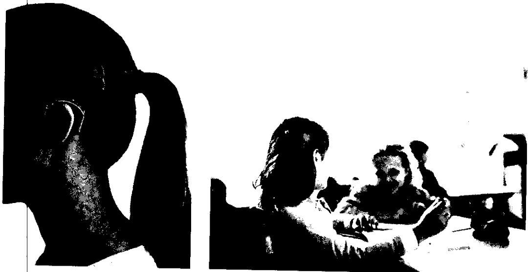
<인공달팽이관 외부장치 착용사진>

보청기로도 소리를 듣지 못하는 고심도 난청인이 받는 수술로 내부 임플란트(달팽이관 삽입)와 외부 장치를 통해 외부의 소리를 전기적 신호로 변환하여 청신경을 자극해 소리를 듣게 되는 수술입니다.